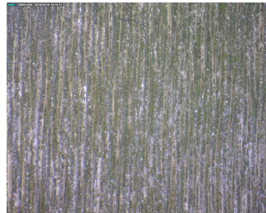
f = 1,5''; P = 100\%; s = 80\%