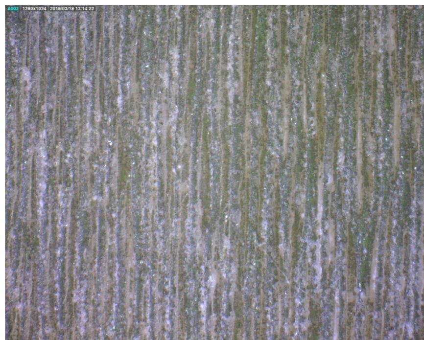
f = 1,5''; P = 100\%; s = 60\%