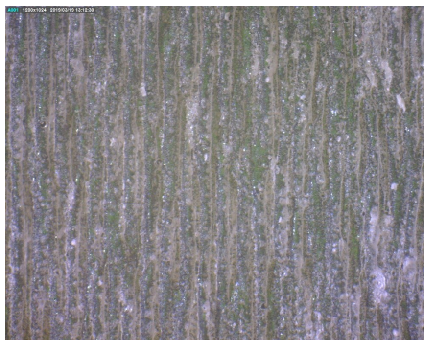
f = 1,5''; P = 100\%; s = 40\%